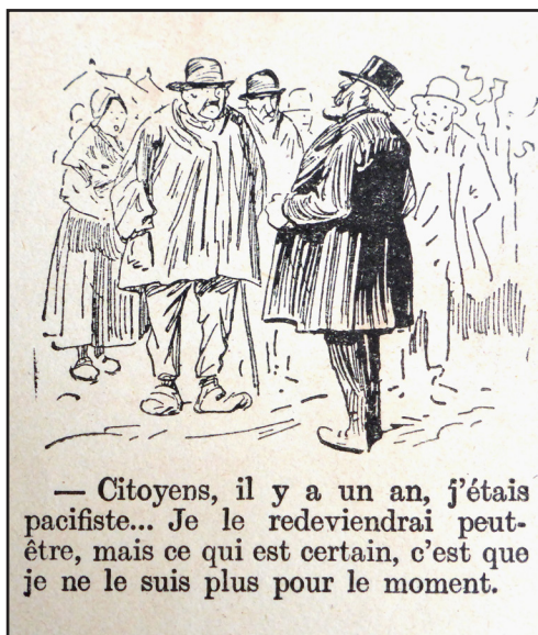
Croquis d'Henriot pour L'illustration n° 3786 du 25 septembre 1915

[1] Voir Victor Augagneur, Erreurs et brutalités coloniales , Montaigne, 1927, sur les troubles engendrés à Madagascar par les impôts, surtout quand ils sont perçus